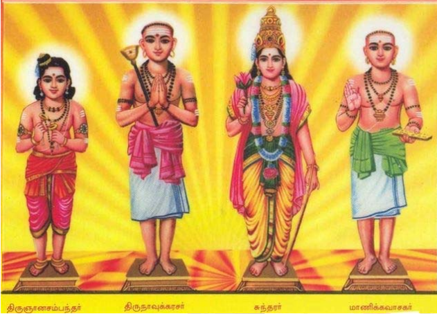
திருஞானசம்பந்தர் திருநாவுக்கரசர் கந்தர் மாணிக்கவாசகர்

தமிழுக்கும் அமுதென்று பேர் - அந்தத் தமிழ் இன் பத் தமிழ்எங்கள் உயிருக்கு நேர் தமிழுக்கு நிலவென்று பேர் - இன் பத் தமிழ் எங்கள் சமூகத்தின் விளைவுக்கு நீர் தமிழுக்கு மணமென்று பேர் - இன் பத் தமிழ் எங்கள் வாழ்வுக்கு நிருமித்த ஊர் தமிழுக்கு மதுவென்று பேர் - இன் பத் தமிழ் எங்கள் உரிமைச் செம் பயிருக்கு வேர்